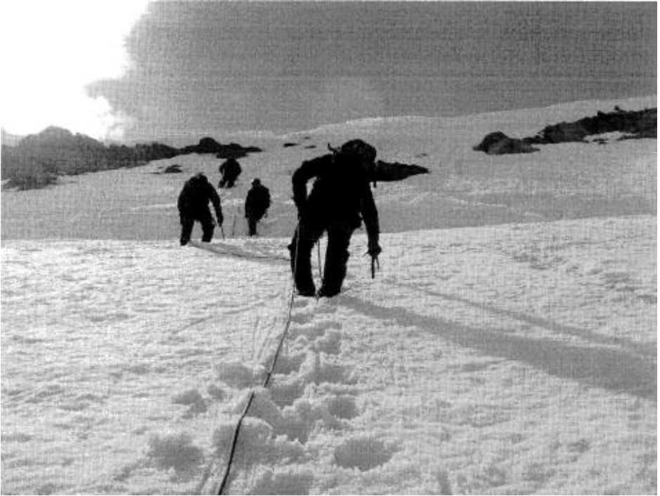
Kohden huippua.