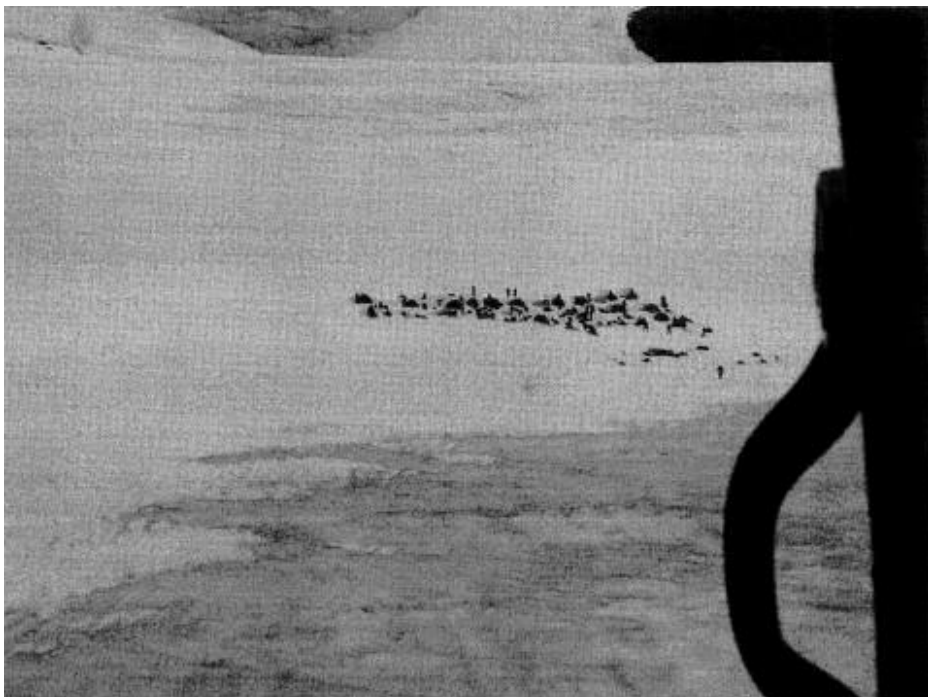
Kuva helikopterista 1.7.2006 klo 15. Alla näkyy storglaciärin jäätikkö ja perusleiri.

Storglaciärin kinoksiin aloimme myös Sarenin kanssa kaivaa paikkaa teltallemme, joka tulisi olemaan kotimme seuraavan seitsemän vuorokauden ajan. Tunturissa tuulee lähes koko ajan, joten teltta oli tarkoitus kaivaa hankeen ja rakentaa sen ympärille pienet vallit lumesta, mistä olisi se hyöty, ettei tuuli heiluttelisi telttaa aivan kamalasti. Teltan ns. upside -osa, eli tavallaan eteinen, kaivettiin reilusti muuta osaa alemmas. Ajatuksena oli tässä se, että teltassa pystyi laittamaan ruokaa ja viettämään muutoinkin aikaa istuen, siten että jalat olivat upsiden puolella ja takalisto makuuosaston puolella (ks kuva seuraavalla sivulla)